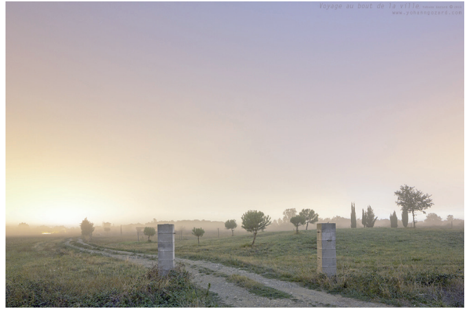
Voyage au bout de la ville , photographie argentique, 2013

Yohann Gozard est photographe. Il travaille en poses longues, explorant exclusivement les paysages nocturnes qu'ils soient urbains, industriels ou ruraux. Sa pratique contemplative interroge notre relation sensible à l'espace construit, notre perception de la nuit, les désirs qui sont liés à l'image et les limites de la représentation. Tout en partant d'une réalité existante, il produit des oeuvres troublantes à cheval entre la photographie, la peinture et l'imagerie 3D.