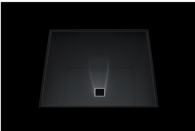
Sans titre , technique mixte, 100 x 50 x 40 cm, 2012

Arnaud Gerniers est un plasticien belge qui utilise la lumière comme matériaux et outil principal.